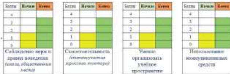
Рисунок 2. Результат уровня сформированности УУД

На рис. 2 представлен результат уровня сформированности УУД ребенка с РАС после окончания периода действия АОП.